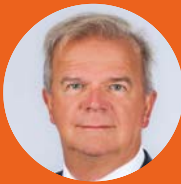
MARTIN VAN GOGH BATENBURG TECHNIEK